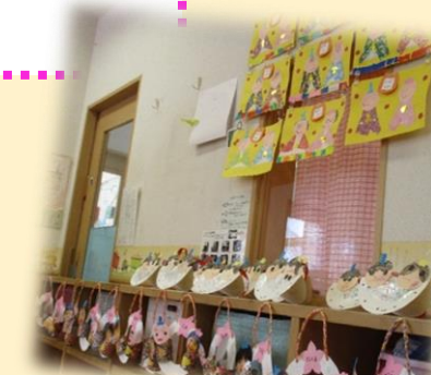
(写真は昨年のものです。)